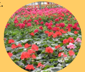
L'acide pélargonique est issu des pélargoniums, souvent faussement appelés géranium.

Ces produits de dés herbage ne sont pas des solutions de routine. Bien qu'ils soient d'origine naturelle, ils ne doivent pas être considérés comme des « dés herbants bio ». Il est important de penser à adopter les solutions préventives (paillage, engazonnement des allées), de tolérer la végétation spontanée et de penser au dés herbage thermique ou mécanique, tout autant efficace !