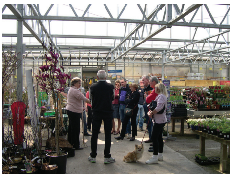
Animation dans une jardinerie engagée