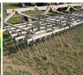
Herse étrille sur blé