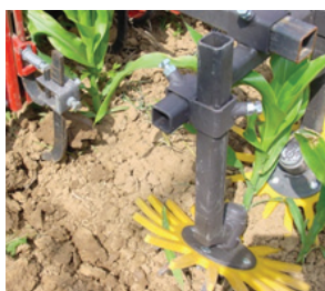
Binage du maïs