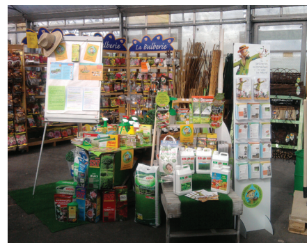
Outils de communication exposés