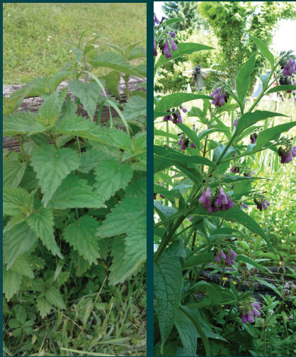
L'ortie et la consoude

Les macérations, purins et autres tisanes à base de végétaux sont des préparations naturelles permettant de renforcer vos plantes et de les protéger contre les attaques potentielles des ravageurs ou des maladies. Par manque de temps, d'informations ou de confiance, de nombreux jardiniers ne les utilisent pas. Georges Macel, de l'écomusée d'Hannonville, nous explique toutes les spécificités de ces préparations naturelles.