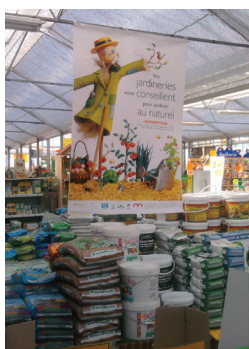
Affiche de la charte