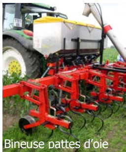
Bineuse pattes d'oie

Les agriculteurs disposent d'une gamme variée d'engins de désherbage non chimique. Ces techniques mécaniques sont toutes inspirées des machines utilisées avant guerre et avant la fabrication des désherbants de synthèse.