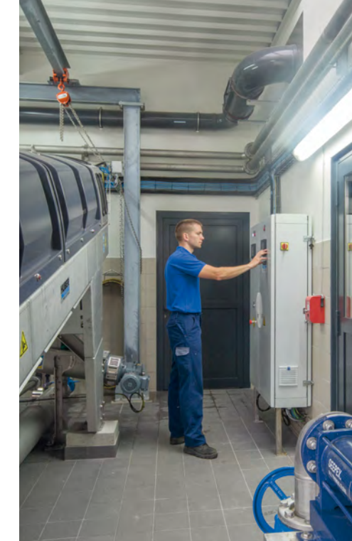
ventilation et production d'eau industrielle

Vue de l'intérieur d'une Presse à Vis Huber Q-PRESS