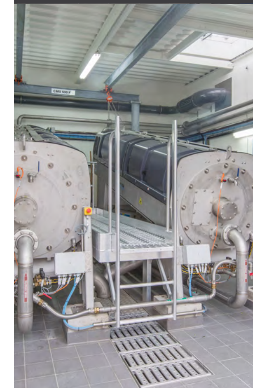
filière boues avec 2 presses à vis